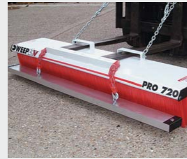
Sterke magneet Verzamelt spijkers en andere ijzerdelen.