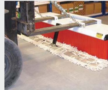
Zwabber Voor fijn afval op gepolijste vloeren.