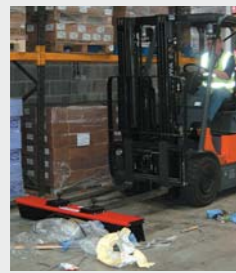
Magazijnen & Opslag