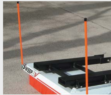
Hoekmarkeerders Geeft de bestuurder goed zicht op de werkhoeek.