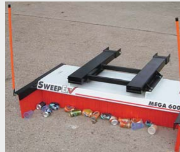
Verzameleind Houdt groot afval bij elkaar.